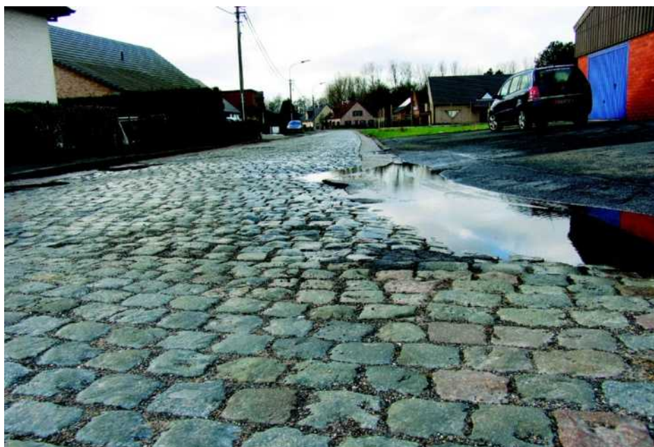
Kasseien, putten, plassen... verdwijnen in de Melkerijstraat.